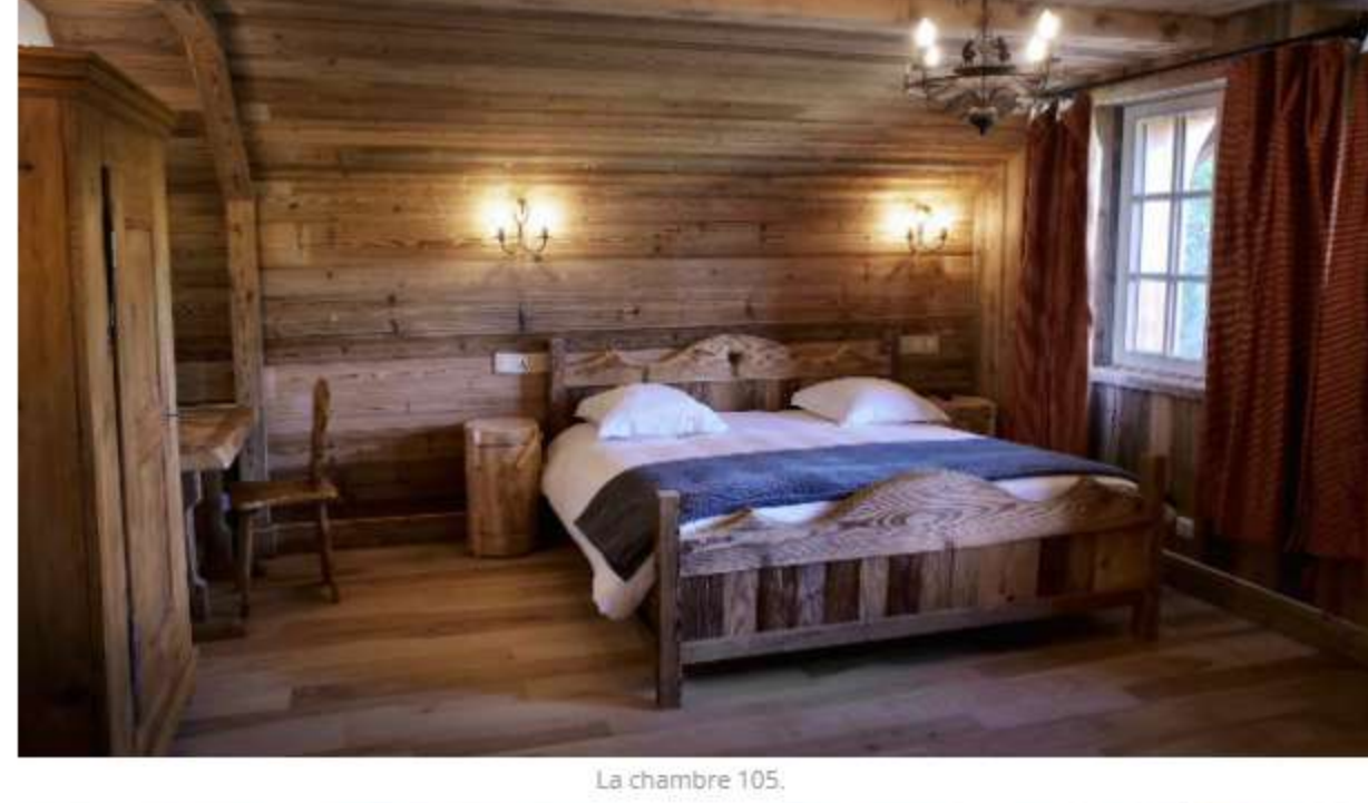
La chambre 105.