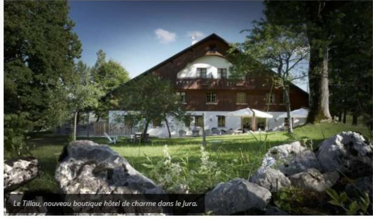
Le Tillau, nouveau boutique hôtel de charme dans le Jura.