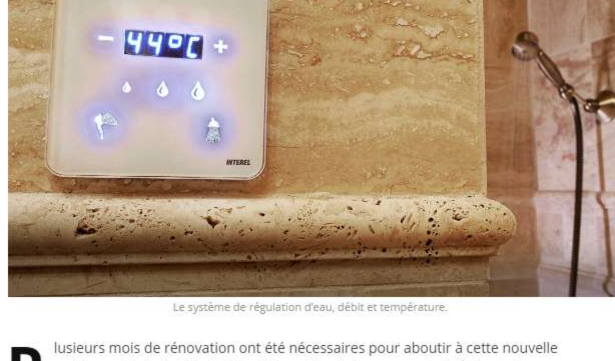
Le système de régulation d'eau, débit et température.

Plusieurs mois de rénovation ont été nécessaires pour aboutir à cette nouvelle ambiance de chalet à la fois traditionnelle, chaleureuse et plutôt haut de gamme sans ostentation. Vieux bois, vieilles pierres, marbres dans des camaïeux de bruns foncés à beige donnent le ton. Ce style » à l'ancienne » où le bois brut est roi n'empêche pas le confort moderne comme on dit et même une domotique de pointe qui s'annonce comme une signature du groupe dont fait partie Le Tillau, la toute nouvelle Compagnie Hôtelière de Haute Joux créée l'an dernier. Avec sa marque Best Secret Hôtel, elle se lance dans le haut de gamme créant technologie, matériaux nobles et terroir, la recette qui sera appliquée dans ses prochains boutiques-hôtels dans les régions françaises.