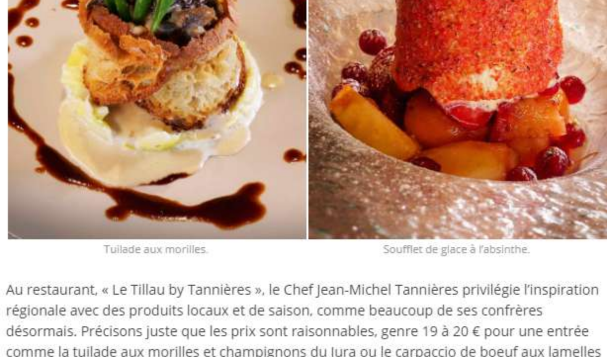
Tuile aux morilles.