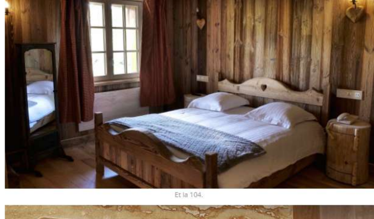
Et la 104.