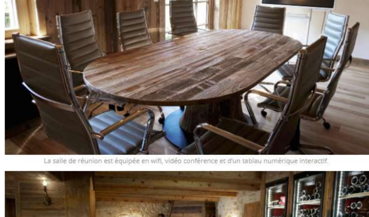
La salle de réunion est équipée en wifi, vidéo conférence et d'un tableau numérique interactif

Tarifs assez doux en basse saison: 100 € ou 115 avec le petit déjeuner pour deux pour les chambres et 120 ou 135 pour les suites.