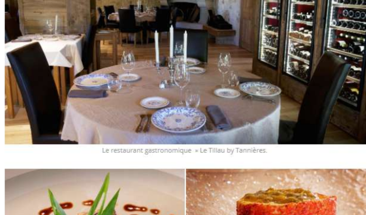
Le restaurant gastronomique « Le Tillau by Tannières